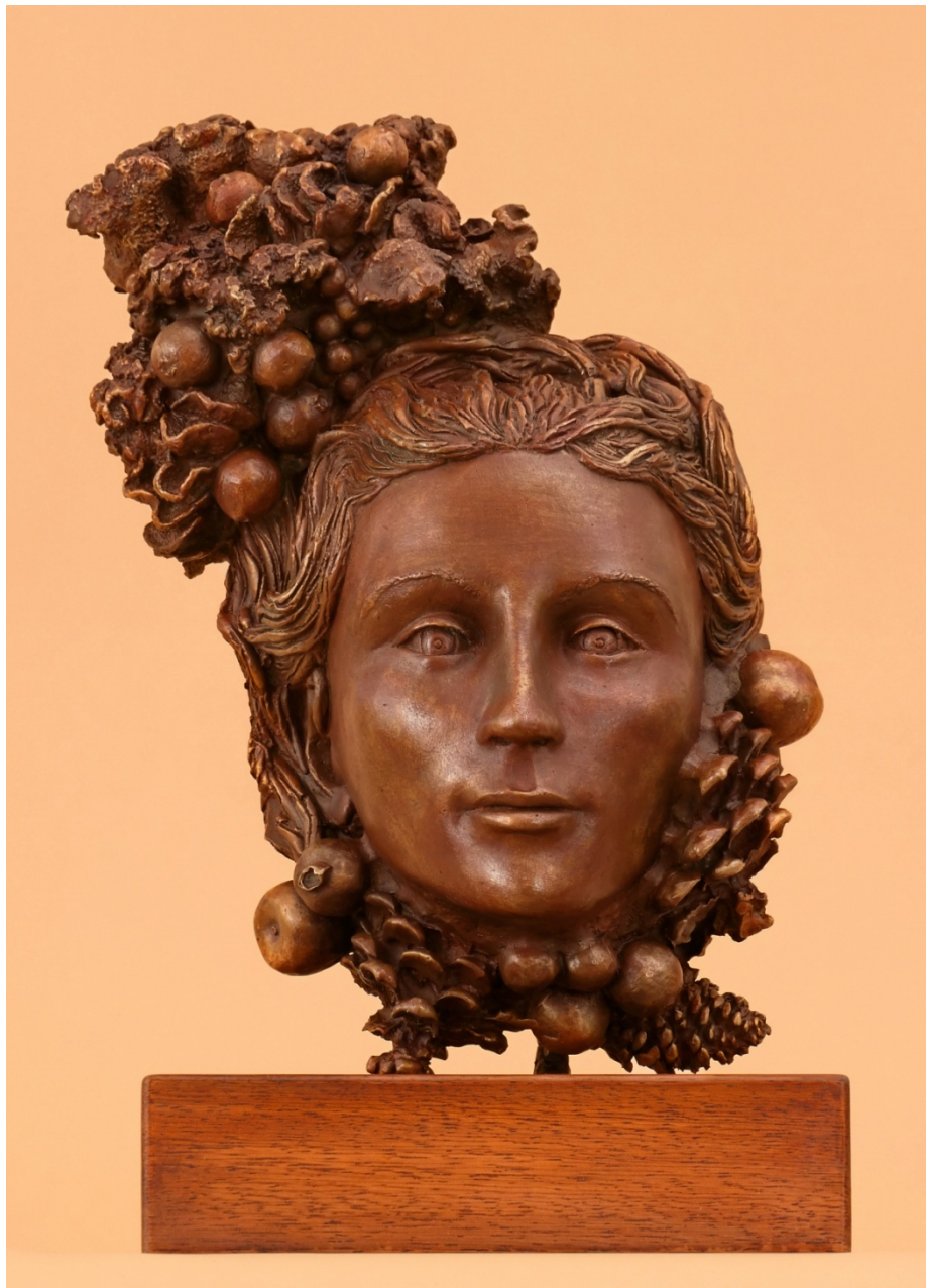
Mongolita, emozioni d'autunno, 2012, bronzo, h. cm. 40