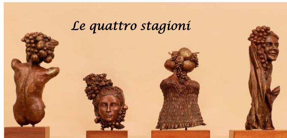
Le quattro stagioni